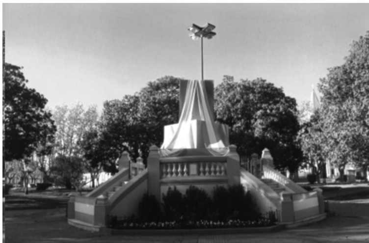
Reducción facsimilar de una fotografía tomada el 25 de Mayo de 2010, al celebrarse los doscientos años de la Revolución de Mayo de 1810