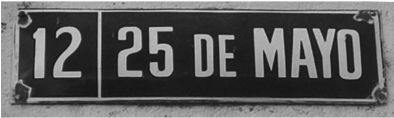
Cartel de chapa enlozada con nombre y número de calle

Se acompañan ilustraciones que reflejan imágenes de la historia que se está narrando; su función es precisamente estética.