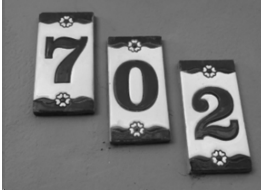
Numeración de casa en ceramico