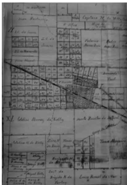
Plano General del Partido de Suipacha de 1899