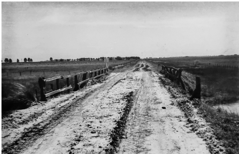
Vista del conocido puente de madera sobre el arroyo Los Leones.

El otro, sobre el Arroyo Moyano, en J. M. García hacia Suipacha, de 15 metros de alto, en metal. Su peso es de 215 toneladas, costó unos $ 60.000, y fue habilitado en mayo de 1925.