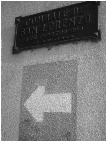
Calle Combate de San Lorenzo anterior a la aprobación de la nomenclatura urbana