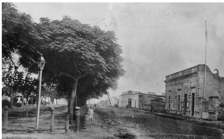
Plaza Balcarce 1899, se observa la antigua Municipalidad vista desde la calle San Lorenzo

Es de amplias dimensiones, la manzana está dividida en cuatro sectores hoy, transformados en triángulos equiláteros, separados por calles interiores. En su ornamentación se alternan esculturas y monumentos, están el busto de San Martín, el monolito a la batalla de Suipacha, a la Madre, a los Héroes de Malvinas, y a la fundadora inaugurado al celebrarse el centenario del Partido en 1964, entre otros.