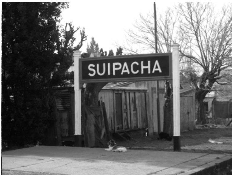
Cartel indicador de localidad en estaciones ferroviarias