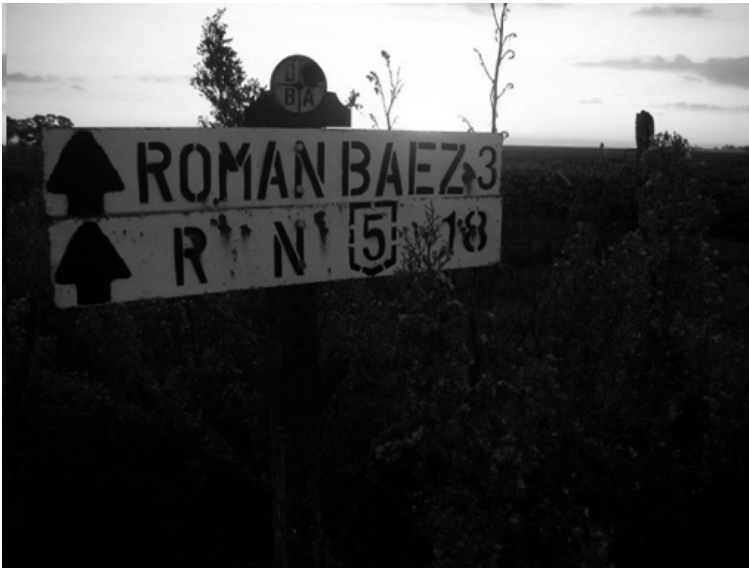
Carteles viales colocados en ruta provinciales y nacionales