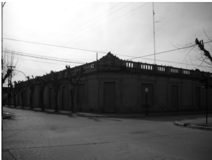
Esquina Diagonal Hipólito Irigoyen, en intersección con las calles Balcarce y Rivadavia