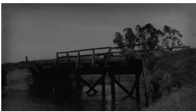
Puente sobre el arroyo "Los Leones"

Aspecto que ofrecía el puente de madera, en los años sesenta, de vital importancia para el transporte de la producción agropecuaria. Año 1964.