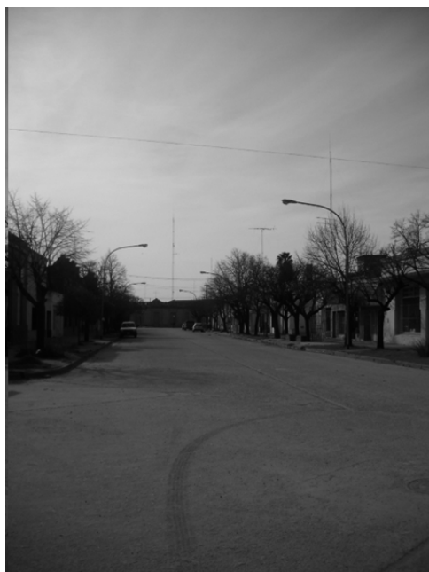
Vista de la diagonal Hipólito Yrigoyen en toda su extensión