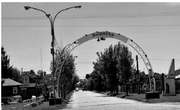
Vista del ingreso a la ciudad de Suipacha por la calle Padre Luis Brady, cuyo nombre es anterior a la Nomenclatura Municipal aprobada en octubre de 1947.