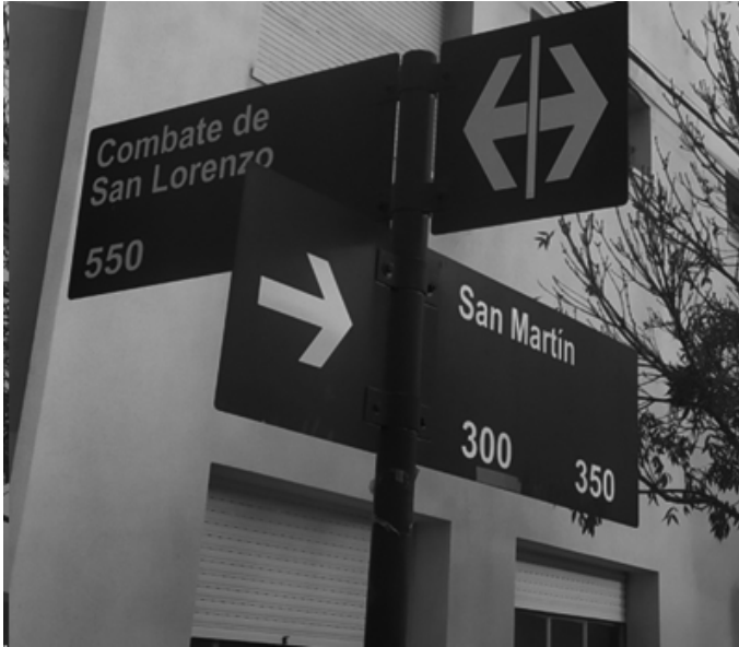
Señal de tránsito reglamentaria indicando dos direcciones obligadas