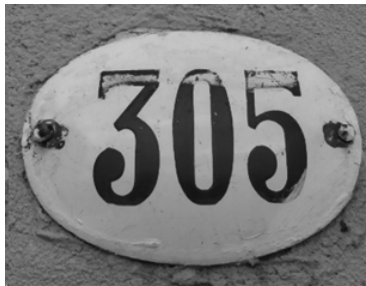
Chapa enlozada con número identificador para domicilio