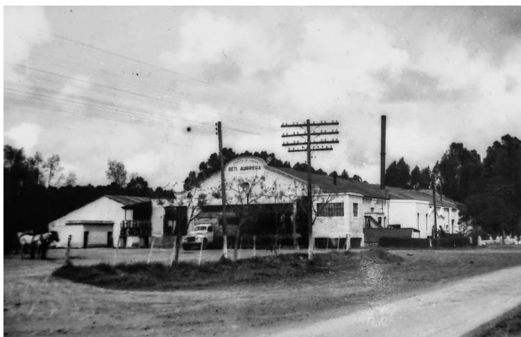
Usina Láctea La Beti Aurrera a un costado del camino de cintura, hoy calle Fragata Sarmiento en la década del 50.