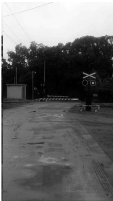
Barrera automática del ferrocarril Sarmiento, en el ex paso a nivel de Moras, proporcionando seguridad y beneficios a los vecinos.